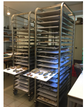
Carlo Glod en train d'étudier une partie de l'industrie lithique recueillie par Roger Wagner sur différentes unités de prospection localisées au nord de Savelborn (2500 pièces).