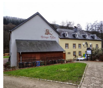
Heringer Millen, lieu de la prochaine assemblée générale

Vin d'honneur offert par la Commune de Waldbillig.